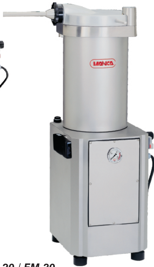
EM-20 / EM-30